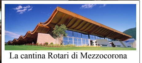
La cantina Rotari di Mezzocorona